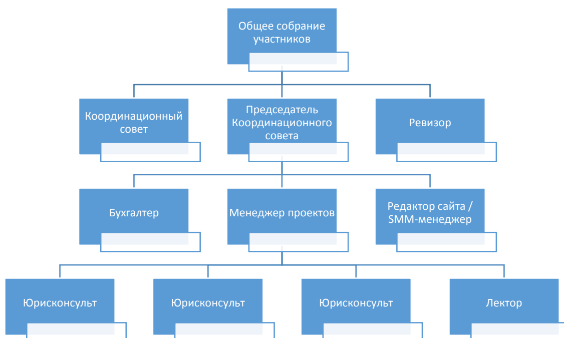
Схема организационной структуры

Ревизор Движения осуществляет ревизию финансово-хозяйственной деятельности, избирается на 5 лет и вправе запросить любую необходимую информацию у должностных лиц Движения.